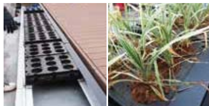
10 マジカルグリーン取付け 緑化ポット設置