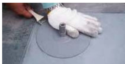
4 ハット成型品 溶着

※『IB設備架台成型品』の詳細に関しては、『サンタックIB ソーラーシステム』カタログをご参照ください。